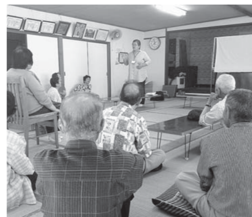
認知症教室の様子（三ヶ公民館）

日時：8月17日（土） 午後1時30分～3時30分 場所：千寿苑 問合せ：地域包括支援センター