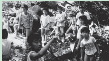
「自然教室」での源流探検