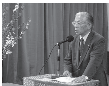
旧下西小改修事業落成式

山都町の宝が大らかに、人間性豊かに、すくすくと成長する環境を大切にしたいものです。