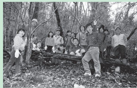
平成15年「早春の森の生きものたち」でのフクジュソウ観察会

この地域一帯の自然林を伐採し、スギの植林をするために枯れ葉剤を散布する計画があった。一部で枯れ葉剤が撒かれたとき、地域の人々の立ち上がりによって阻止されたのだ。もしも計画通り枯れ葉剤が撒かれていたことは大変なことになったことは間違いない。現在、九州中央山地の自然林は「森林生物遺伝資源保存林」の指定を受け保全されている。子どもたちの未来に、この豊かな自然を残したい。 本年度は、子どもたちや地域の方々と一緒に、天主人に登って観察会をする予定だ。