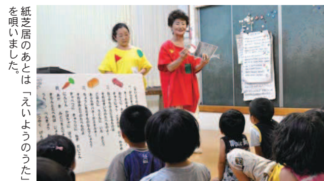
紙芝居のあとは「えいようのうた」を唄いました。

紙芝居で 食生活改善 ～食生活改善推進員～ 7月23日、同和保育所で食生活改善推進員による紙芝居がありました。当日、園では園児が保育園に宿泊する「お泊まり保育」の実施中。推進員の4名の方が、食事を終えた園児たちに、紙芝居「ありがとう、早寝・早起き・朝ごはんマン」で朝ごはんの大切さを訴えました。その後、保健師による歯みがき指導があり、園児たちは鏡を見ながら自分で丁寧に磨いていました。