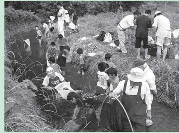
平成21年7月「シビンタ観察会」の様子

ニュージーランドの地震を心配していましたが、東北地方太平洋沖地震のマグニチュード9.0という記録的な規模と津波の被害の大きさに驚きました。被災された方に心からお見舞い申し上げます。被災地域の一日も早い復興を願っています。