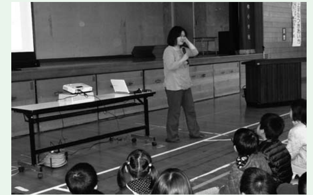
真剣に話を聞く子どもたち