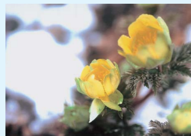
写真:「目丸山の春」