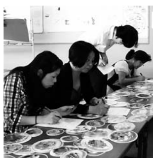
料理カードバイキング