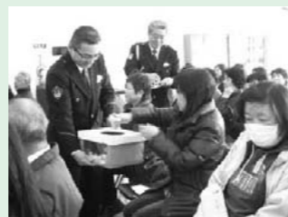
(2月27日達成チームへの賞品抽選会の様子)

昨年9月1日～12月31日の102日間、町内の方々が3人1組となり計151チーム(453人)が「無事故・無違反」にチャレンジされました。今回は137チームが無事故・無違反を達成されました。引き続き、無事故・無違反をお願いします。