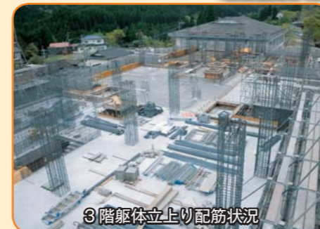
3階躯体立上り配筋状況

現在、3階の床まで完成しました。これから上棟に向けて柱・床の鉄筋・型枠の作業になります。