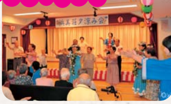
浜C地区からの出し物フラダンス。入所者の方々と踊りました。