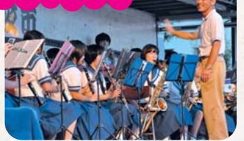
矢部中学校吹奏楽部の演奏では指揮者体験もありました。