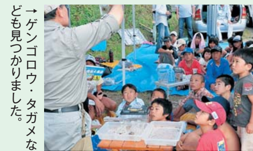
→ゲンゴロウ・タガメなども見つかりました。