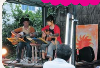
JINN&KUMIによるギター演奏と歌