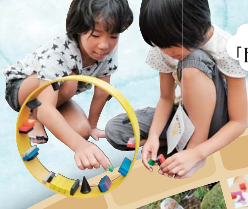
7/31(火) ワークショップ 「ドイツ生まれの楽しいゲーム」