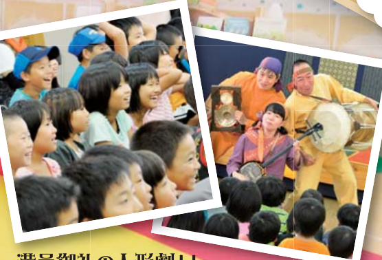
満員御礼の人形劇!! 子どもたちの笑い声が絶えませんでした