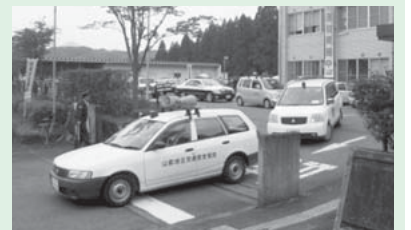
パトロールへ出発!