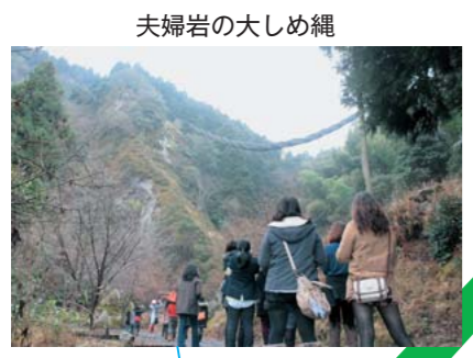
夫婦岩の大しめ縄

これは、山都町・美里町・御船町・甲佐町の4町が連携して行う緑川流域の観光PRの一環で行われました。