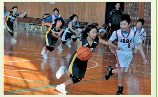
5年生以下男女ブロックの戦い

2月9日、「第7回山都町学童ミニバスケットボール大会」が町内4つの小学校体育館で行われました。大会には、6つの小学校が参加。6年生の男子が2つのブロック、6年生女子が1ブロック、そして5年生以下男女が1ブロックに分かれ、激しくも和やかな戦いを繰り広げました。各ブロックの優勝チームは次のとおり。