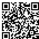
講座一覧のQRコード

https://www.pref.kumamoto.jp/site/agri-academy/79487.html