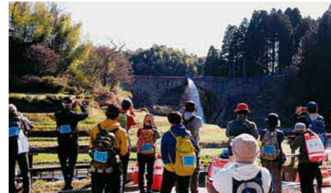
通潤橋特別放水の様子