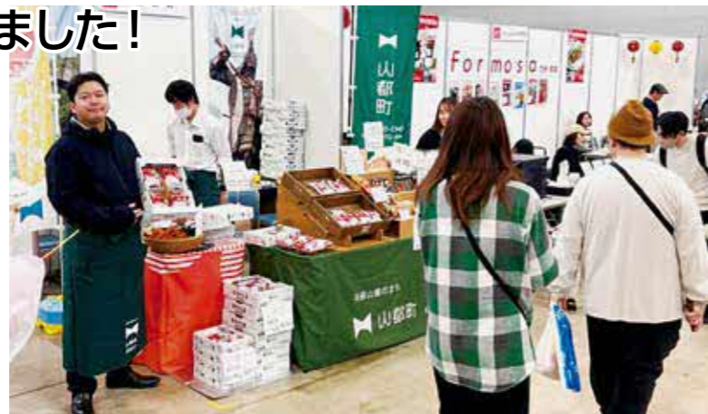
山都町ブースの様子

2月28日、3月1日の2日間グランメッセ熊本にて「すぱいす感謝祭」が開催されました。山都町の特産品も出品され、町産果実を使ったジャムや通潤橋をモチーフにした石橋型積木などが並びました。当日は多くの方々にご来場いただき、山都町の魅力を広く発信する貴重な機会となりました。