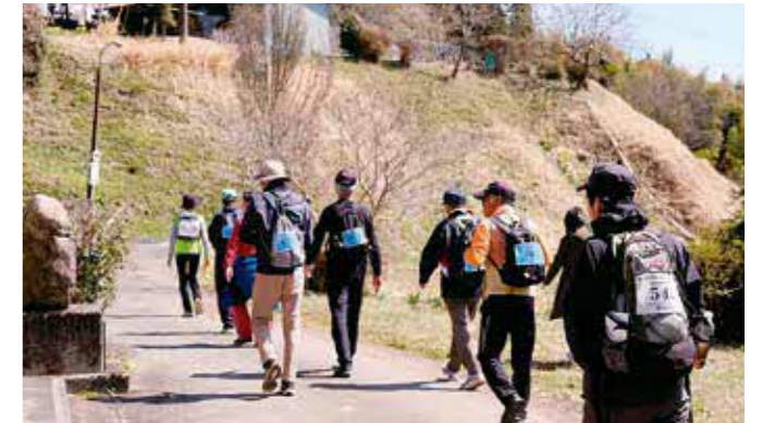
ウォーキング中の様子