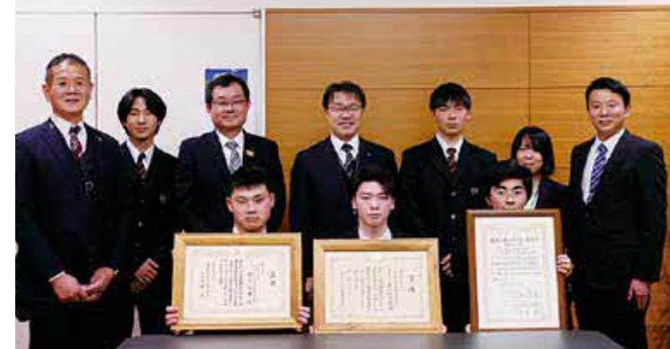
矢部高校のみなさん