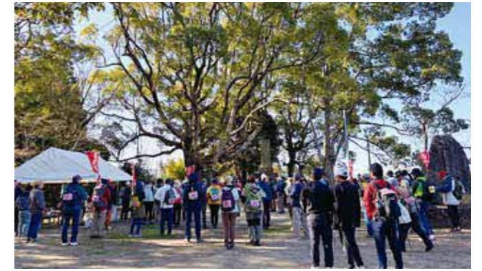
1日目出発式の様子

3月14日、15日に「日向往還歴史ウォーク in YAMATO(山都町)」が開催されました。1日目の「めざせ通潤橋コース」、「浜町散策ほろよいコース」と2日目の「めざせ馬見原コース」、「馬見原歴史散策コース」を合わせて約250名の方が参加されました。両日とも天候に恵まれ、各コースで、地元の方々のおもてなしもあり、参加者はとても喜ばれておりました。2日間を通して、多くの方にご参加いただき、山都町の魅力を感じていただく良い機会となりました。