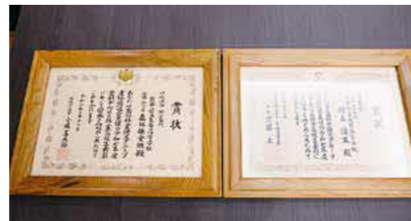
林野庁長官賞(左) 優良賞(右)