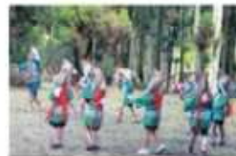
高畑年祢神社御田植え祭り

田植え祭りは稲の豊作を祈って農作業の田植えの各過程を模擬的に所作する神事です。菅笠をかぶった子ども達が、畦きりや田起こしなどの場面を舞います。