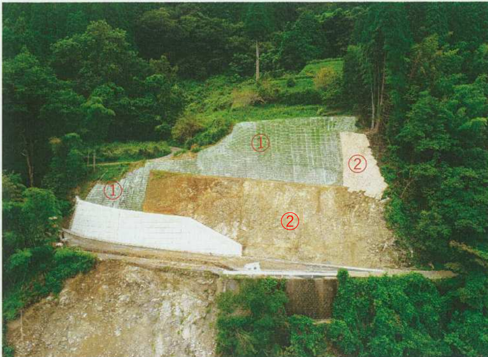
①植生マット工 ②植生マット工（厚層タイプ） ③現場打軽量吹付法砕工