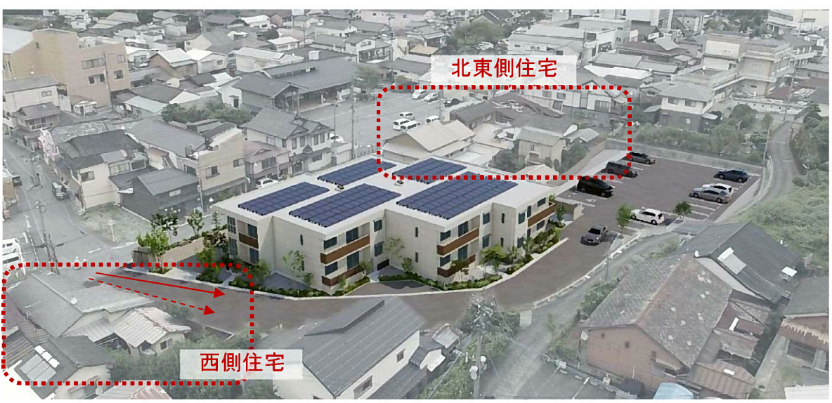
鳥瞰パース (南西側より)