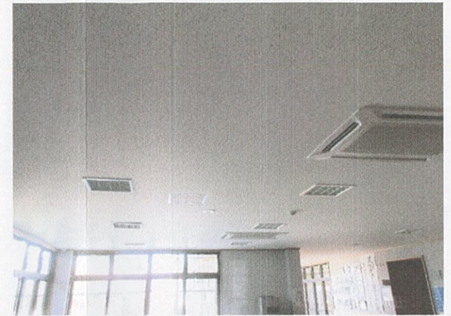
談話コーナー (保健センター)