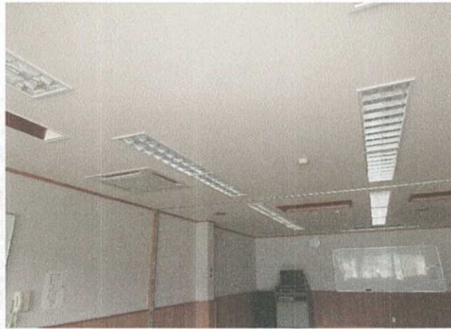
ボランティア室・研修室