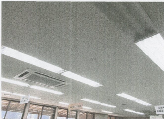
事務室・ヘルパー室 (福祉センター)