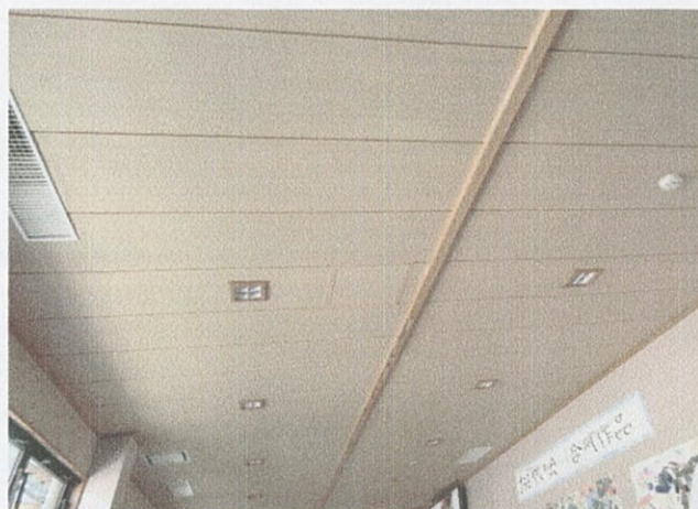
談話コーナー (保健センター)