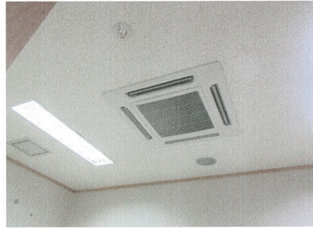
相談室 (福祉センター)