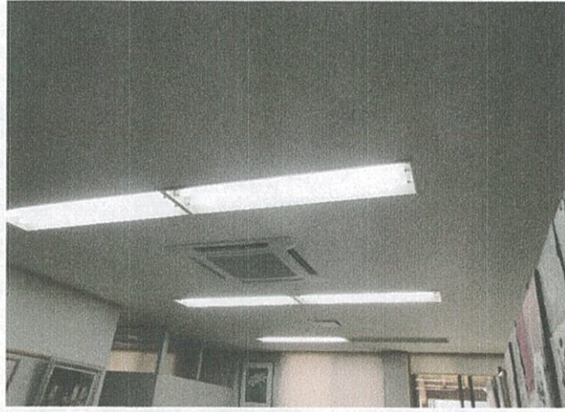
事務室 (保健センター)