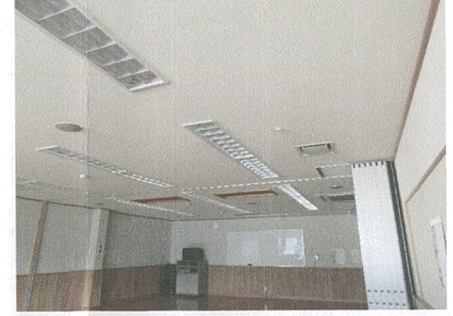
ボランティア室・研修室