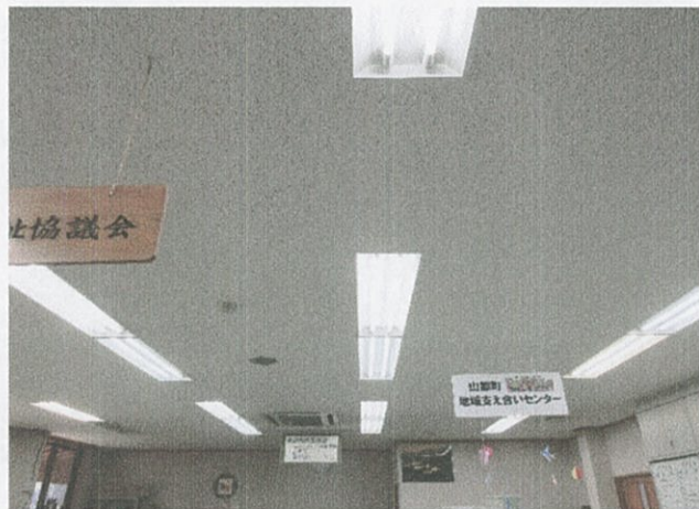
事務室・ヘルパー室 (福祉センター)