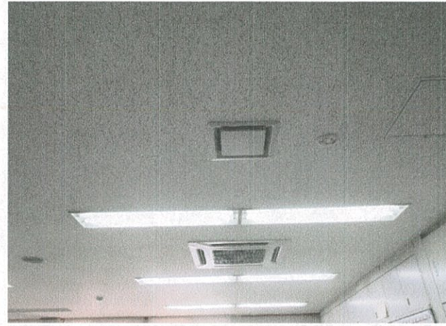
事務室 (保健センター)