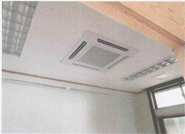
相談室 (保健センター)