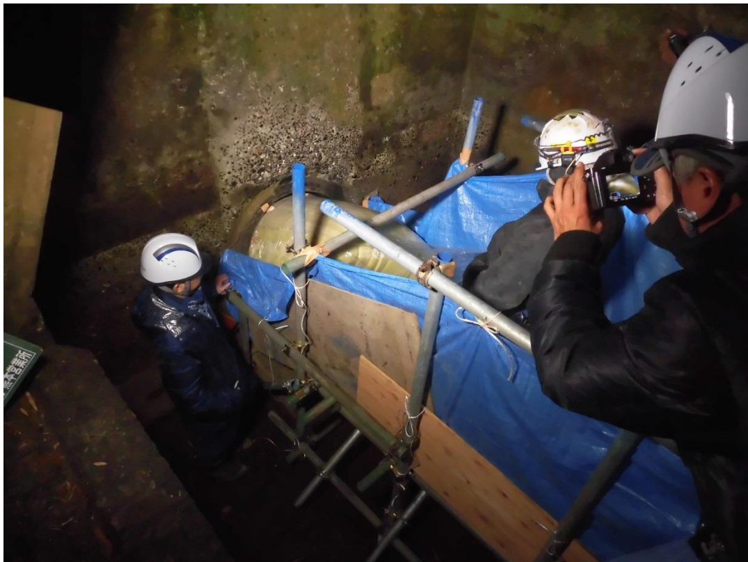
写真6 管更生材 出口側到達状況（岩尾城側）