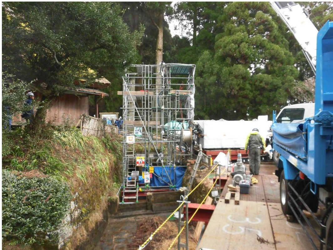
写真2 管更生材反転挿入用 仮設タワー