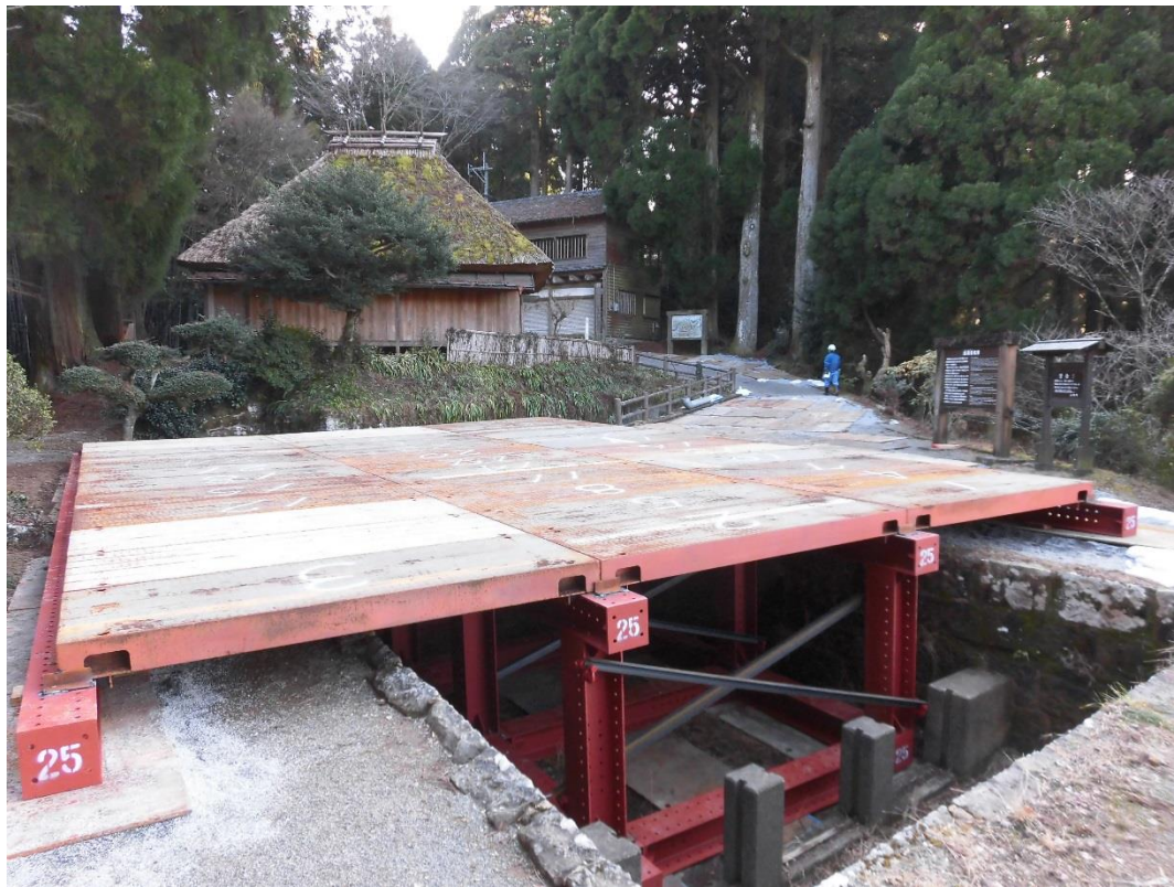
写真1 通潤橋吹上池上に設置した管更生材仮置きのための仮設台