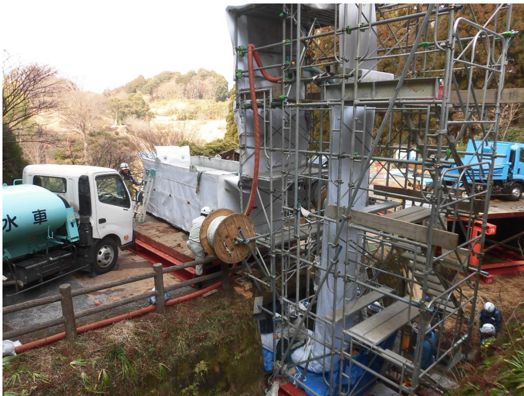
写真3 管更生材反転挿入の状況