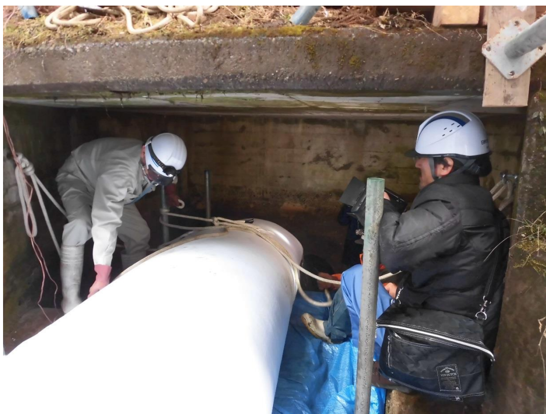
写真4 管更生材反転挿入の状況（ヒューム管出口側）