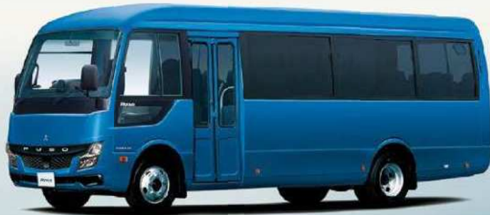
写真はプロライン。撮影用特別仕様車。