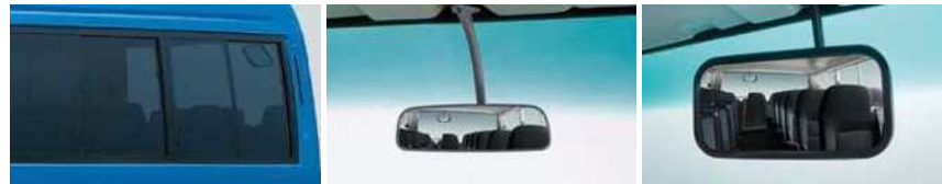
濃色グレーガラス