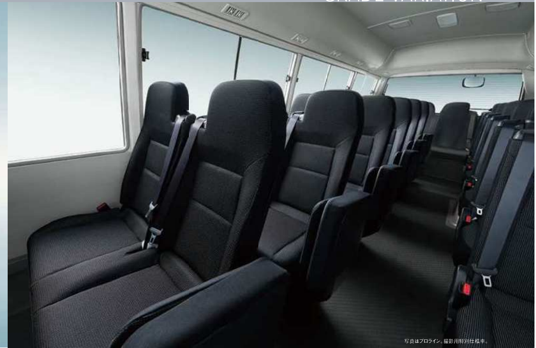
写真はプロライン。撮影用特別仕様車。